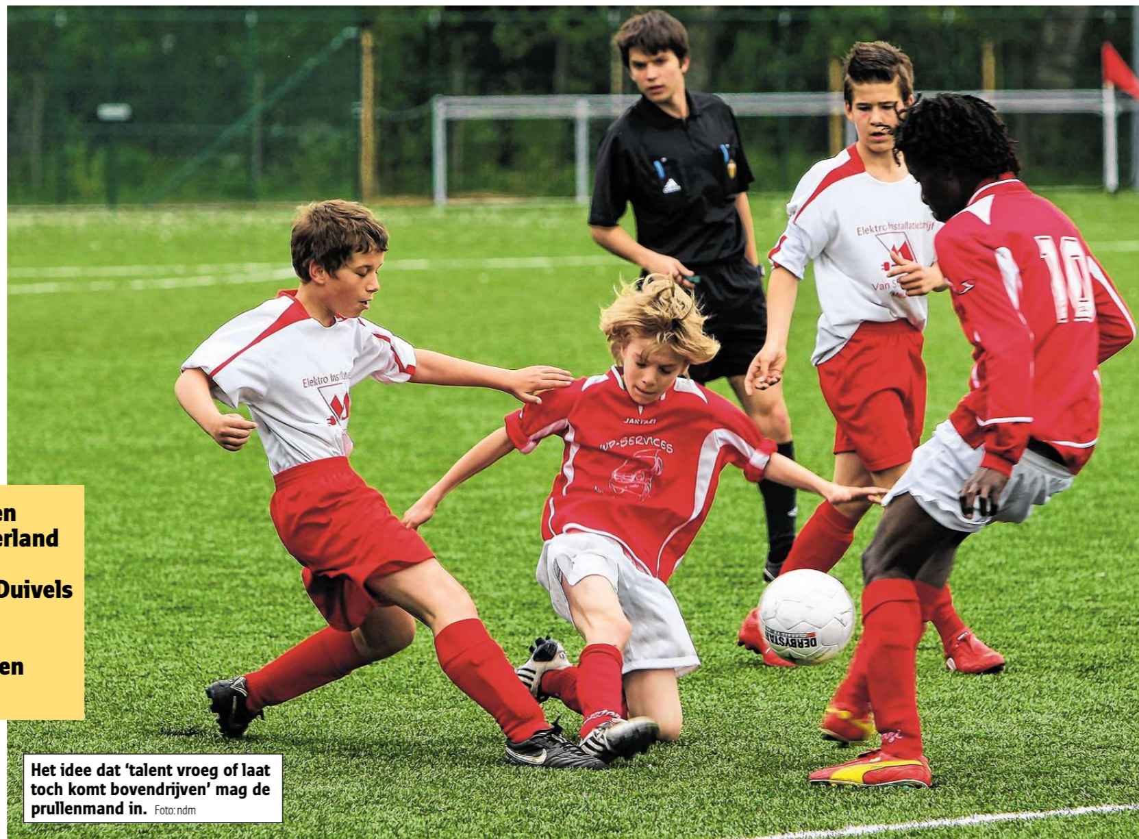
Het idee dat 'talent vroeg of laat toch komt bovendien' mag de prullenmand in.

Tien jaar later blijken deze maatregelen onvoldoende. Van de 368 spelers die dit seizoen in eerste klasse in actie kwamen, werden er 222 geboren in de eerste jaarhelft, goed voor ruim 60 procent. Merkbaar minder spelers, 146 of een kleine 40 procent, vierden hun verjaardag na 30 juni. Het idee dat 'talent vroeg of laat toch komt bovendien' mag met een de prullenmand in. 'Ik ben verbaasd dat de ongelijkheid ook op volwassen leeftijd nog zo groot is', zegt Joosen die vandaag fysiektrai-